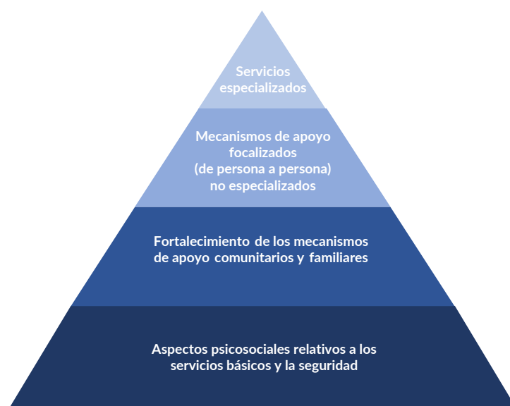
Figura 1. Pirámide de la Guía del IASC sobre Salud Mental y Apoyo Psicosocial en Emergencias Humanitarias

En un enfoque integral de SMAPS, los actores profesionales y comunitarios trabajan juntos en la pirámide para satisfacer las necesidades de la comunidad, y requieren ciertas competencias y estándares mínimos.