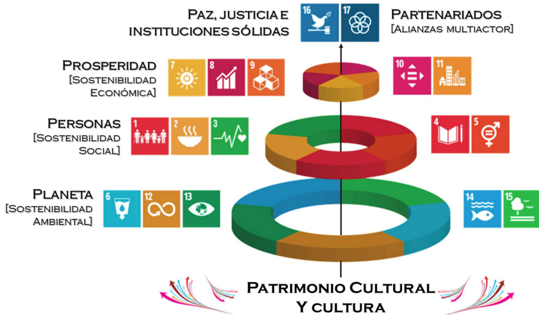
Ilustración 2. Visión del desarrollo humano sostenible de la Agenda Canaria de Desarrollo Sostenible 2030

[Párrafo 27] Para cada una de las dimensiones de la ACDS, se presenta, por este orden, su alcance en relación al desarrollo sostenible, un breve análisis de la situación de partida de Canarias, los principales retos estratégicos o problemas estructurales (retos región) que debemos atender, y las grandes áreas de actuación (políticas aceleradoras) y sus líneas de acción prioritarias. Los retos región y las políticas aceleradoras recogidas en la ACDS se basan en aquellos reflejados en el documento de las Directrices Generales de la Estrategia de Desarrollo Sostenible 2030 publicado por el Gobierno de España, con el fin de alinear las hojas de ruta a nivel nacional y regional. Por último, el apartado dedicado a cada una de las dimensiones se cierra presentando las metas específicas de Canarias en cada ODS (metas canarias), identificadas a partir del trabajo realizado en 2018 por el Parlamento de Canarias y del proceso participativo multiactor abierto para su revisión durante el año 2020.