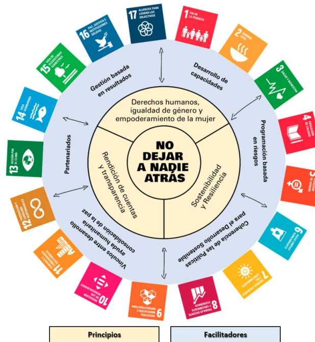
Ilustración 3. Principios y facilitadores para el logro de los Objetivos de Desarrollo Sostenible

[Párrafo 159] Ninguna organización, ni pública ni privada, podrá contribuir de manera efectiva al logro de los ODS sin adaptar su estructura organizativa, su cultura y su modelo de gestión. Esta aseveración ofrece otra lectura, acaso más propositiva, a saber: las organizaciones, también las organizaciones públicas, pueden considerar los ODS como una oportunidad única para cambiar y crear un entorno mejor para el desarrollo de su propia misión definiendo un marco estratégico adecuado para alcanzar una visión alineada con el buen gobierno en la que los ODS se convierten en palancas de innovación y cambio organizativo.